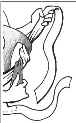
2) Verschlingung beider Enden.