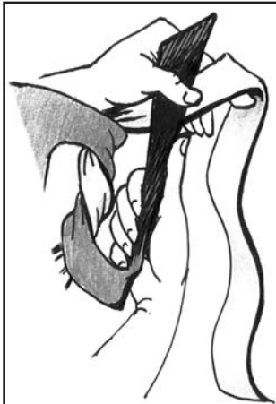
3) Langes Ende um kurzes Ende führen und als halbe Schleife durch die entstandene Öffnung heraus und...