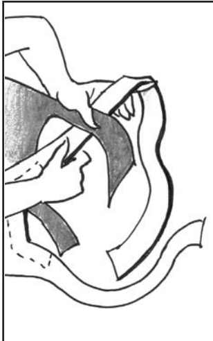
1) Vor der ersten Verschlingung: kurzes Ende über langes Ende.